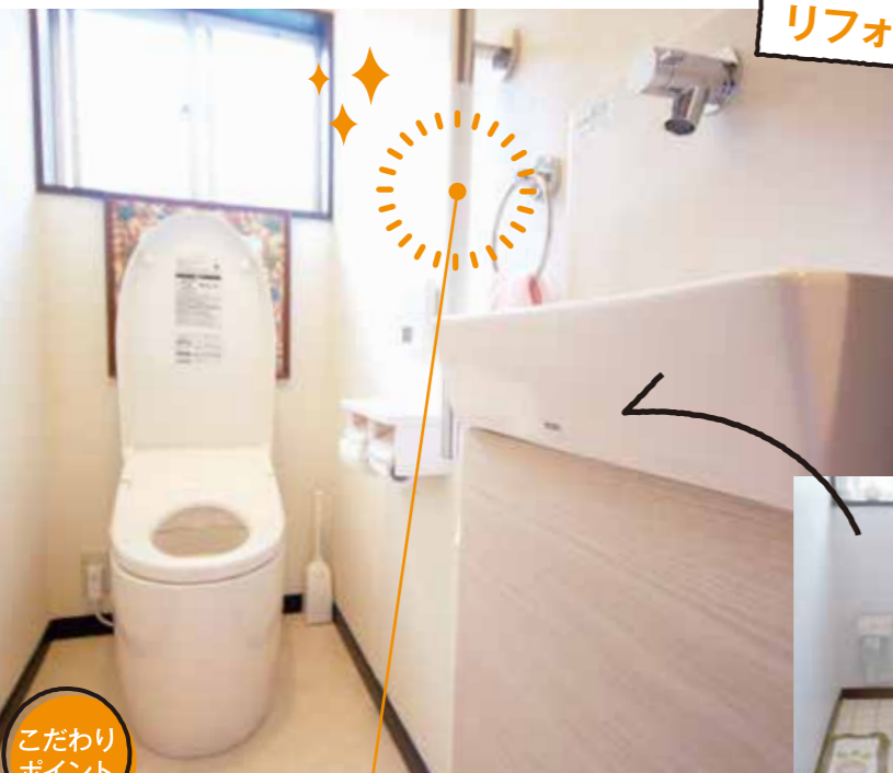
こだわりポイント