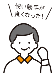
こだわりポイント